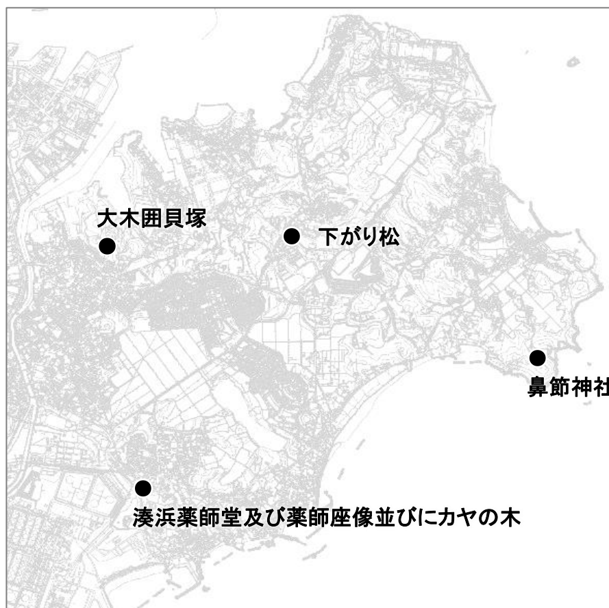
■指定史跡・天然記念物位置図